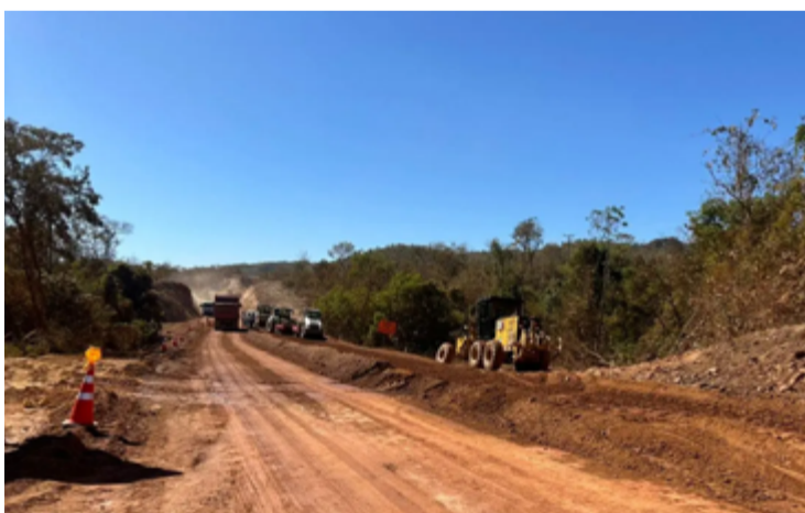
Obras na GO-132 foram retomadas com serviços de terraplenagem nos quase 14 quilômetros não pavimentados

Com a conclusão desses trabalhos, será realizada a aplicação do Tratamento Su-