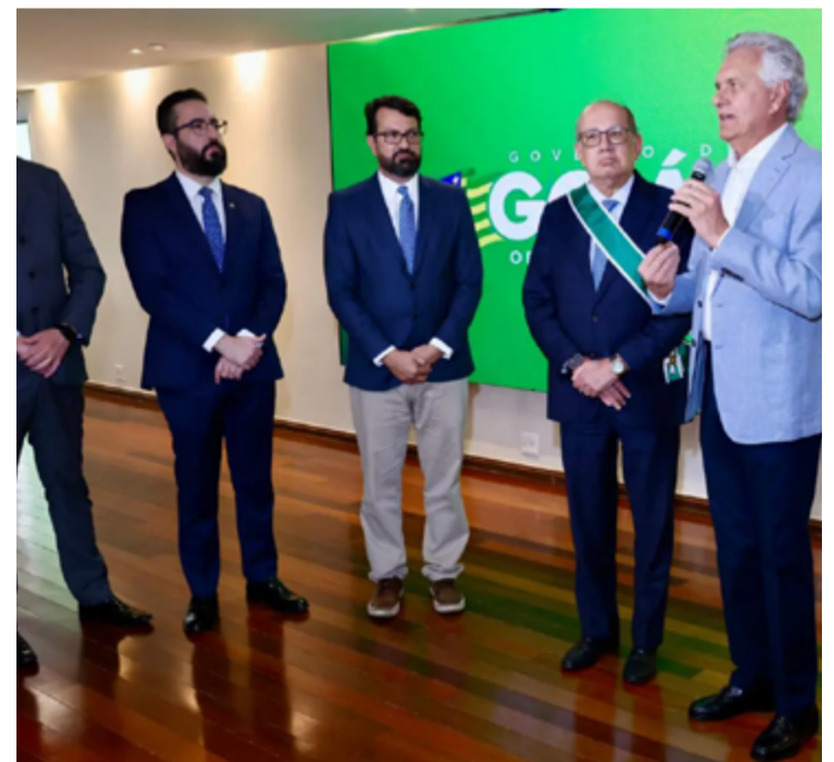
Ronaldo Caiado, Gilmar Mendes e autoridades