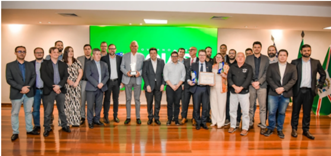
Ronaldo Caiado se encontra com servidores da TI: prêmio de estado mais digital do Brasil

Durante encontro com o pessoal da área de Tecnologia de Informação (TI), Caiado agradeceu os avanços. “O que temos na área de transferência de dados e de serviços digitais levou a avanços substantivos na educação, na segurança, e em programas sociais. Agora, não podemos diminuir o ritmo de maneira alguma”, disse o governador. Caiado pediu empenho aos especialistas para que utilizem as ferramentas de inte-