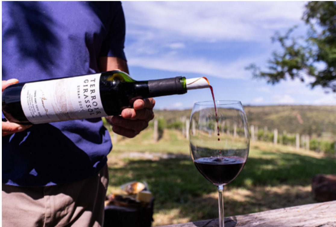
Os embaixadores participaram de uma imersão personalizada nas maravilhas da rota dos queijos e vinhos da região

"Temos trabalhado com muito carinho neste projeto e estamos muito felizes por ser Cocalzinho a cidade que abrirá esse primeiro semestre de visitas, porque é um local que te conquista não só pelo visual, mas pelo paladar, e faz parte da Rota dos Pirineus, tão famosa.