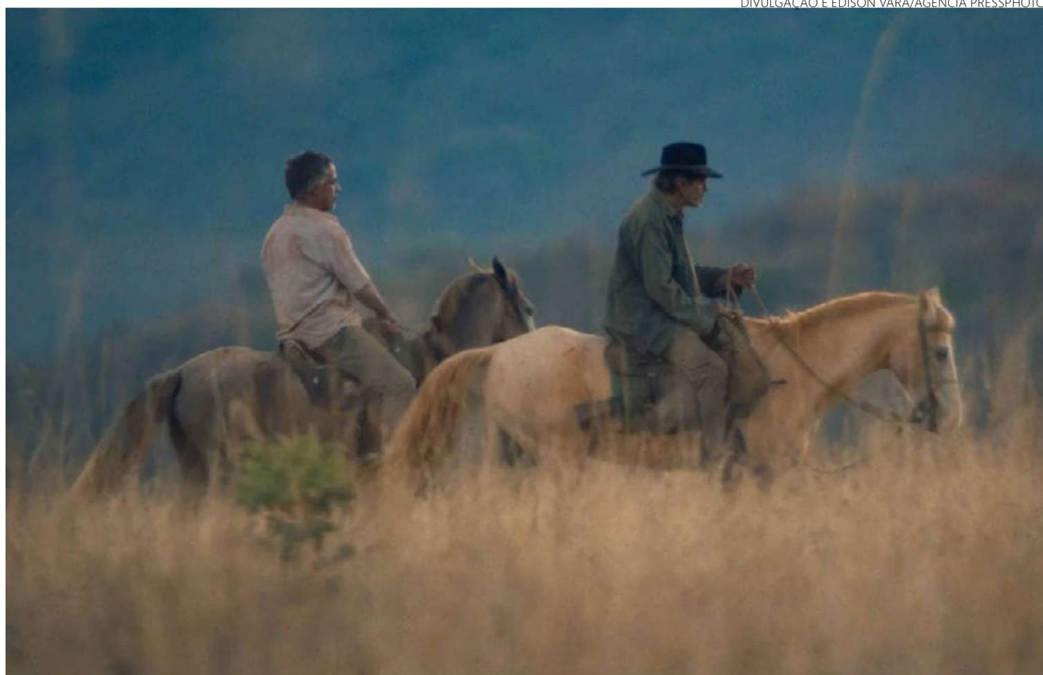
‘Oeste Outra Vez’ foi rodado na Chapada dos Veadeiros, a cerca de 400 km de Goiânia: Cerrado retratado na telona

A história se entrelaça à de outros amargurados incapazes de processar qualquer emoção e de dialogar. A raiva não é a estampa de suas personali-