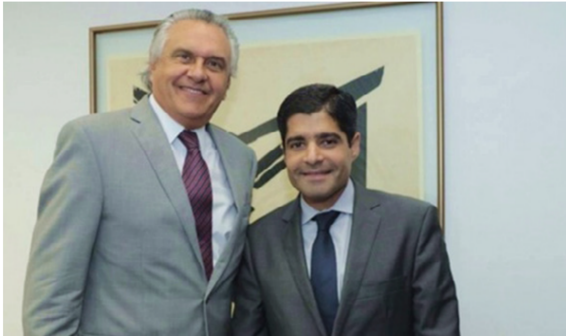
Ronaldo Caiado e ACM Neto: fortalecimento do União Brasil nos municípios

Participaram da conversa o presidente nacional do partido,