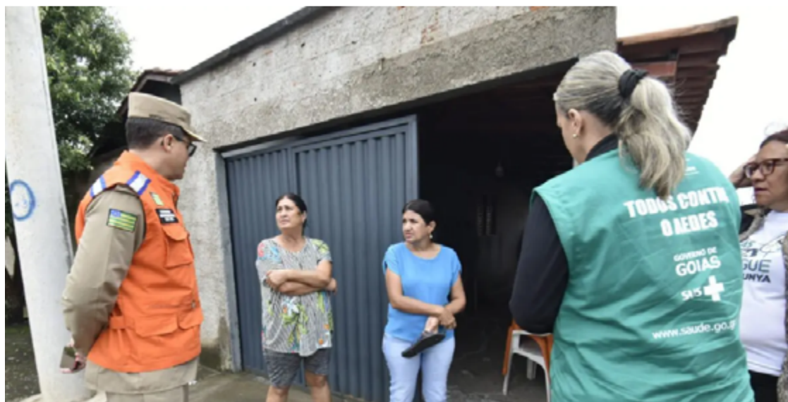
De casa em casa, agentes procuram por focos do mosquito Aedes aegypti

Essas ações de combate à dengue incluem o monitoramento do número de visitas domiciliares e