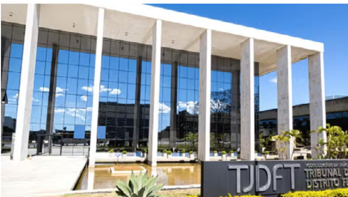
A sentença foi proferida pelo 2º Juizado de Violência Doméstica e Familiar Contra a Mulher de Brasília

Dentro do apartamento, a polícia encontrou a criança al-