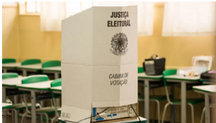
O fato de haver apenas dois candidatos ao cargo de prefeito em cada um desses municípios é uma característica notável e que merece análise

Apesar do número elevado de candidatos a vereador, o fato de haver apenas dois candidatos ao cargo de prefeito em cada um desses municípios é uma característica notável e que merece análise. Essa situação pode ser atribuída a alguns fatores, incluindo o alto custo das campanhas eleitorais, a polarização política, e o contexto socioeco-