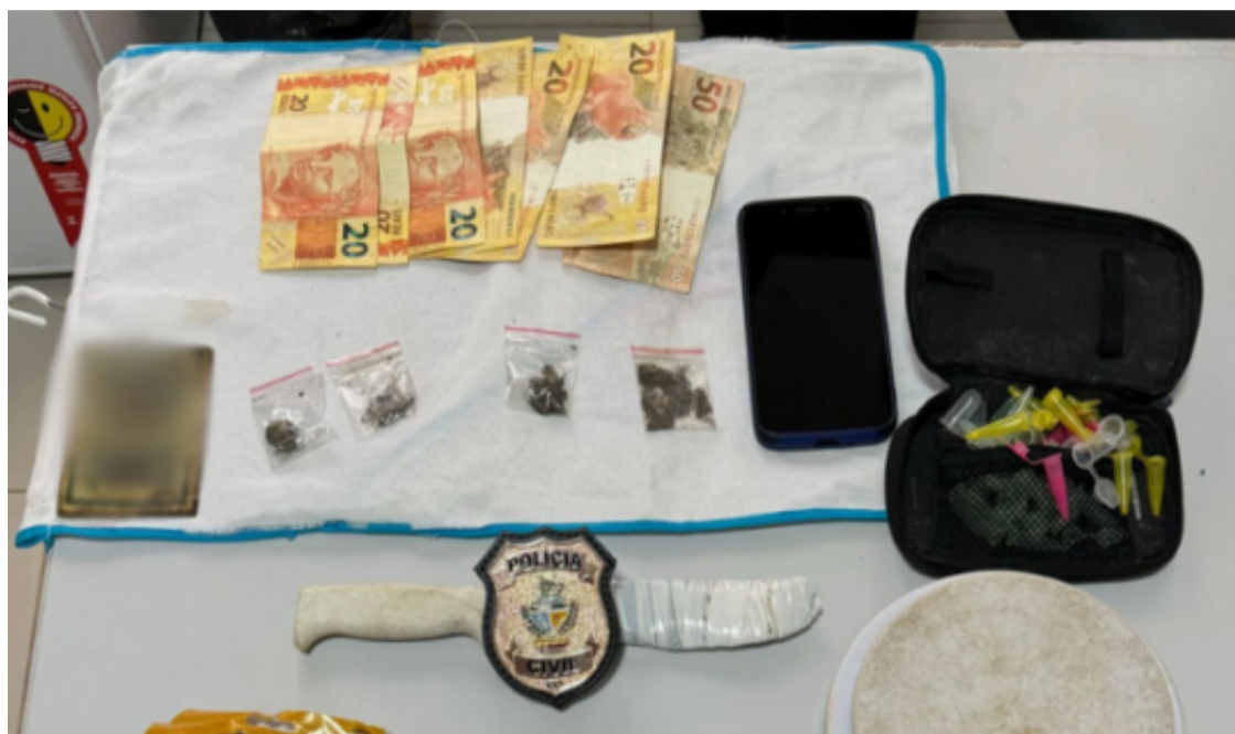
Foram apreendidos materiais que indicavam a prática do tráfico, como embalagens, pinos para acondicionamento de drogas e balança de precisão

Os agentes da DEAM, ao entrarem na residência do investigado e de sua companheira, localizaram diversas porções de uma substância semelhante à maconha, prontas para comercialização. Além disso, foram apreendidos materiais que indicavam a prática do tráfico, como embalagens, pinos para acondicionamento de drogas, uma balança de precisão e uma quantidade significativa de dinheiro em espécie. Durante a busca, os policiais também encontraram munições de calibre .9 mm, de uso restrito, o que