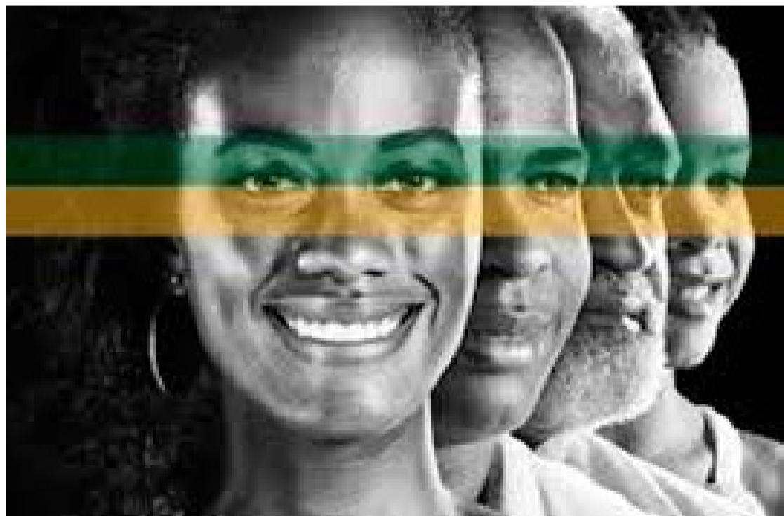
Candidatos negros concentram mais no Legislativo do que o Executivo

Considerando o conjunto geral, as candidaturas municipais chegam a se aproximar da realidade racial brasileira. Segundo dados do Censo 2022 do IBGE (Instituto Brasileiro de Geografia e Estatística), a população do Brasil é composta por 55,5% de pessoas que se autodeclararam negras e 43,4% brancas. Indígenas e amarelos